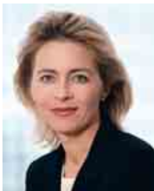
Bundesfamilienministerin Ursula von der Leyen

Sehr geehrte Leserin, sehr geehrter Leser,